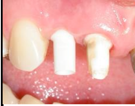
Fig 11 : Pilier ZiReal® non préparé.

un sourire gingival, une gencive fine et festonnée où le risque de récessions gingivales est plus fréquent.