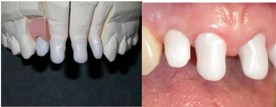
Fig 13 : Essai des chapes sur le modèle et en bouche.

Pour optimiser le résultat esthétique, il a été décidé de réaliser des couronnes Procera. Une première séance permet de contrôler de manière conventionnelle les chapes en oxyde d'alumine réalisées par CFAO, une fois validées, le prothésiste va monter une céramique cosmétique spécifique, de sorte à obtenir des couronnes de formes et teintes compatibles avec l'esthétique et la fonction.