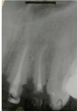
Fig 6 : Traitement de racine sur 21 et 22.