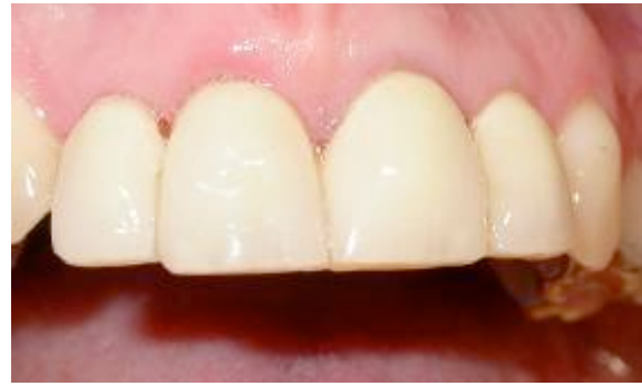
Fig 4 : Prothèse provisoires.