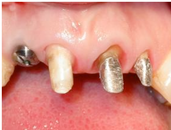
Fig 9 : Vue vestibulaire après cicatrisation à 3 mois.