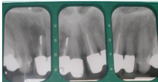
Fig 2 : Radiographies.