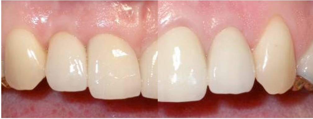
Fig 14 : Restaurations prothétiques sur modèle et après scellement.

L'évolution des techniques de chirurgies implantaire, des piliers prothétiques, des matériaux cosmétique et d'assemblage permet d'optimiser les résultats esthétiques de nos restaurations prothétiques. Chaque étape du plan de traitement doit être menée avec rigueur et une relation étroite doit exister entre les différents protagonistes (praticien prothésiste, chirurgien, technicien de laboratoire).