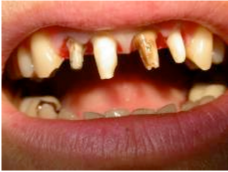
Fig 3 : Dépose des restaurations prothétiques.