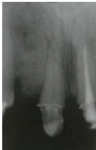
Fig 5 : Radiographie après extraction et comblement de l'alvéole de 12.

La couronne provisoire de la 12 est immédiatement transformée en intermédiaire de bridge en extension