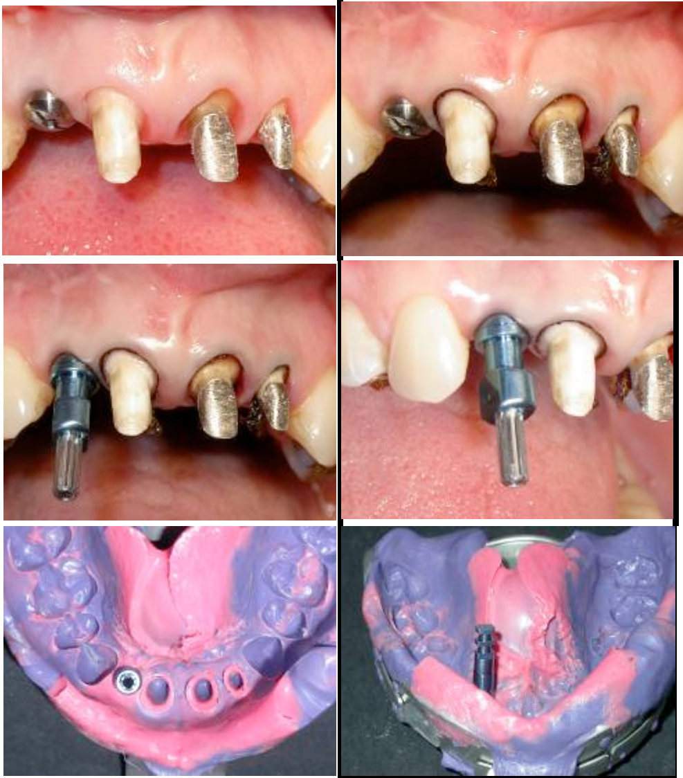
Fig 10 : Etapes cliniques de l’empreinte.