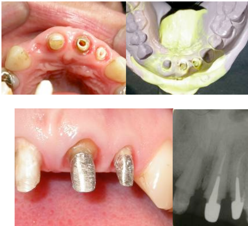
Fig 7 : Logements de tenons, empreintes et scellement des inlay-core.